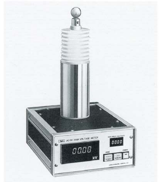
※写真はオプション装備品です。 DHM-20A/M Photo is optional equipment.